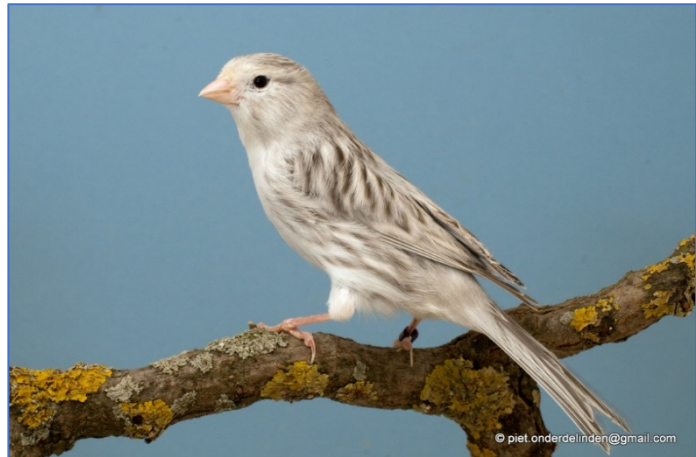
agaat wit recessief

Dominant en Recessief, sterke concentratie van het zwart in de bevedering, slag- en staartpennen zijn parelgrijs omzoomd. Mooie heldere grondkleur, maar niet te helder wit. Bij de dominante Agaat Witten minimale aanwezigheid op de buitenste randen van de vleugelpennen. Fout is te diep geel of oranje aanslag.