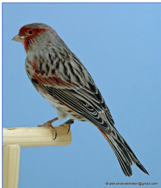
agaat rood mozaïek type 2

De mozaïeken mogen ook in het ivoor worden geshowd.