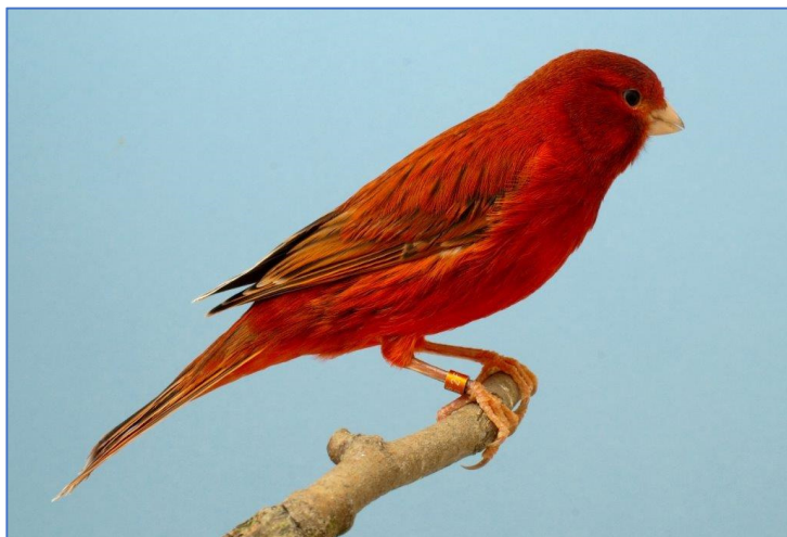
Agaat rood intensief

Bij de agaten kunnen wij dan met symbolen M+ (melaninefactor) en z+ rf, de laatste twee letters staan dan voor de 1 e reductie factor. Gereduceerd melanine.