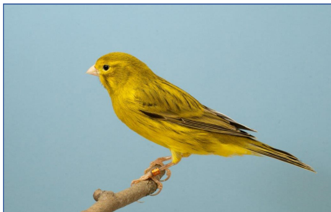
agaat geel intensief