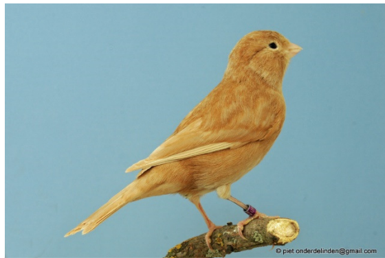
Bruinpastel wit dominant

De bruine melanine ligt als een dichte sluier, zonder bestreping over de gehele bevedering. De lipochroomkleur moet steeds zichtbaar blijven. De poten, nagels en snavel moeten éénkleurig bruinachtig zijn.