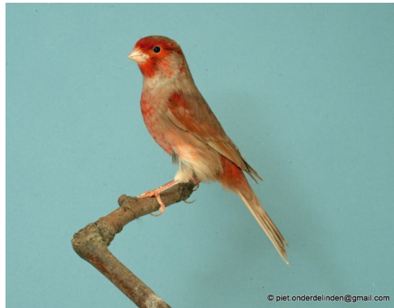
Bruinpastel roodmozaïek type 2

Deze kleurslag in het vraagprogramma is de afgelopen jaren niet zo fors veranderd. Alleen bij de zwart pastellen is precies als bij de gewone zwarten de bestreping fors toegenomen en moet dan ook in banen liggen. De mutatie pastel, ook wel de 2 e reductiefactor genoemd, veroorzaakt dat het eumelanine wordt verminderd. Bij de zwarten en de agaten blijft de bestreping goed zichtbaar. Bij de bruinen en isabellen is de bestreping verdwenen, bij deze vogels ligt er een soort van melanine waas over de vogels. Bij de bruinen natuurlijk veel donkerder dan bij de isabellen. De kleur pastel is in veel variaties te fokken en te showen. Zwart, bruin, agaat en isabel. In de grondkleuren wit, geel en rood. Intensief, schimmel en mozaïek en ook nog in het ivoor.