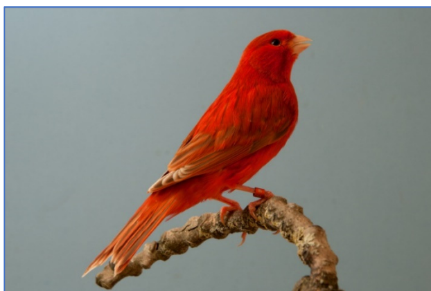
Isabel rood intensief

Type 2: Dit zijn de mannen in deze kleurslag, i.p.v. een klein oogstreepje hebben deze vogels een masker, mooi vol zonder haakjes zijn vaak de beste. Precies als bij de poppen moet het mozaïek patroon mooi zuiver diepgeel of rood en intensief zijn. De mozaïeken mogen ook in het ivoor worden geshowd.