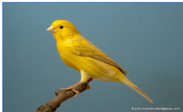
Isabel geel schimmel

Eigenlijk moet ik nog meer letters uit de formule weergeven, maar dat doe ik niet anders wordt het te ingewikkeld. Op ons vraagprogramma staan negen groepen Isabel, ook nog onder verdeeld in subgroepen.