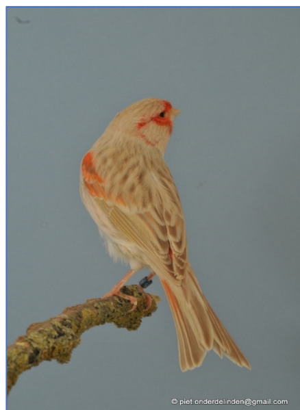
Isabel rood mozaïek type 2

Fout is te zware of te zwakke schimmelverdeling.