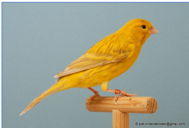
Isabel geel intensief

Deze kleurslag in het vraagprogramma is de afgelopen jaren niet zo fors veranderd als de zwarten en de bruinen. De isabellen zijn bruinen met gereduceerd melanine. Dus in bruin omgezet eumelanine en gereduceerd phaeomelanine. De rug, de flanken en kop vertonen bruinbeige bestreping, fijn, kort en talrijk. De grote bevedering, vleugel- en staartpenen hebben een bruinbeige kleur met uitzondering van een fijne omzoming met lipochroomkleur aan de buitenkant van de veer, teken van een duidelijke verdunning (zie vraagprogramma). Het totale melaninepatroon komt overeen met de agaat, maar natuurlijk sterk verdund van tint. De kleur Isabel is in vele variaties te fokken en te showen. In de grondkleuren wit, geel en rood. Intensief, schimmel en mozaïek en ook nog in het ivoor.